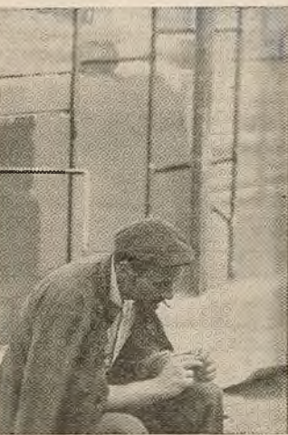
[Заканчэнне. Пачатак на 2—3 стар.]

... Бадай, гэта быў самы цікавы дзень за ўвесь час на-шага жыцця ў Усць-Ілімску. Фестываль сабраў у адно мес-ца ўсіх тых, хто з розных кут-коў нашай Радзімы, з розных куткоў свету прыехаў сюды, каб унесці свой уклад у бу-